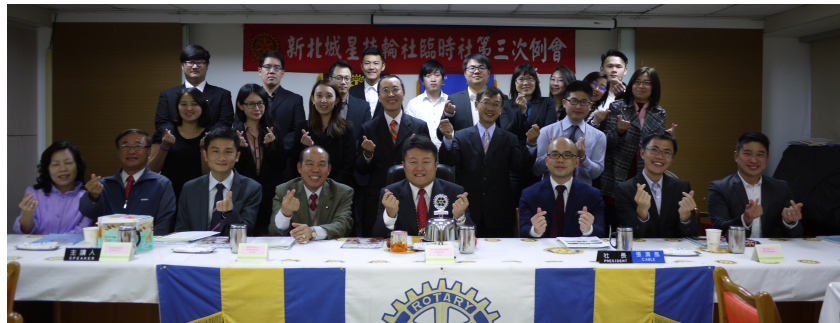
臨時社第三次例會圓滿成功!!