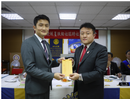
感謝 Brand 帶來精彩的演講，並將主講費捐回