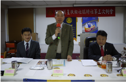
祿姆 Press 致詞勉勵