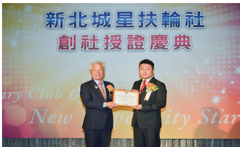
Concrete 總監領發 R.I. 證書