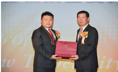
Eiko 社長致贈輔導委員禮品