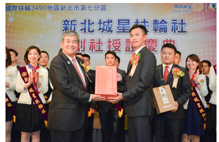
DVS Cut 致贈全體社友禮品