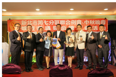
第七分區聯合例會圓滿舉行