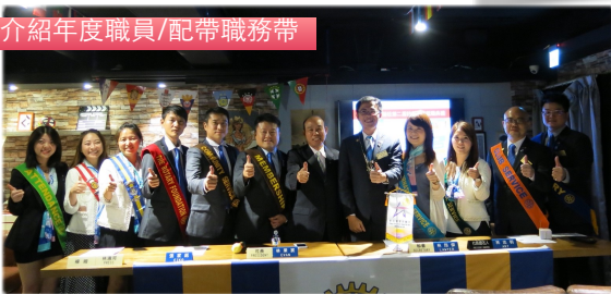
介紹年度職員/配戴職務帶