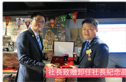
社長致贈卸任社長紀念品