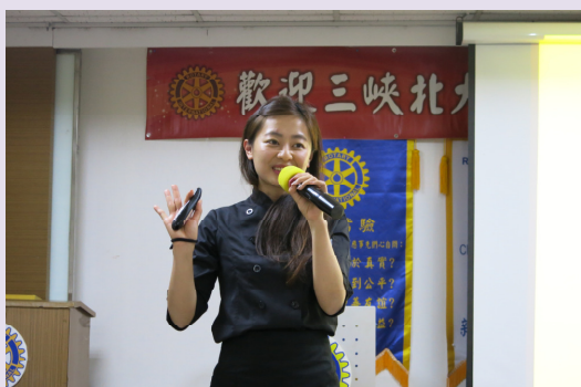
妃貝瑞魔法烤箱創辦人 小妃老師蒞臨演講