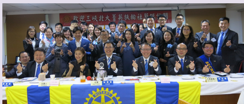
三峽北大菁英社組團蒞臨訪問