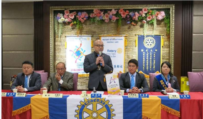
Art 社長主持第 65 次例會