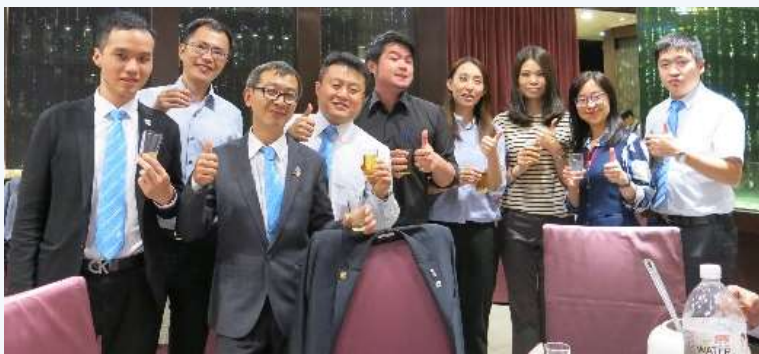
爐主敬酒，感謝爐主們盛情招待