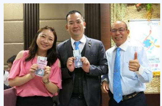
祿姆 Press 提供紅包由 Jo 及 Ian 抽中