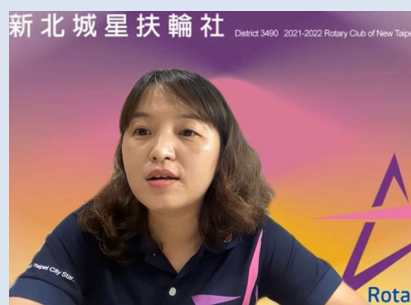
Joy 社長報告 WCS 世界社區