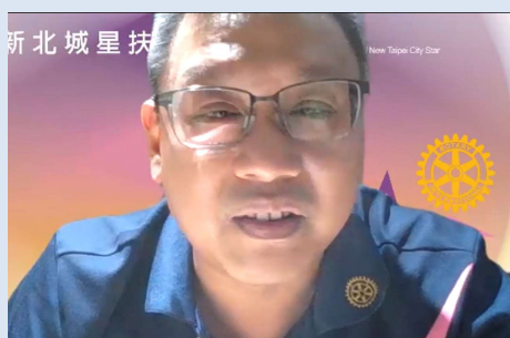
Cube 職業主委作職業分享