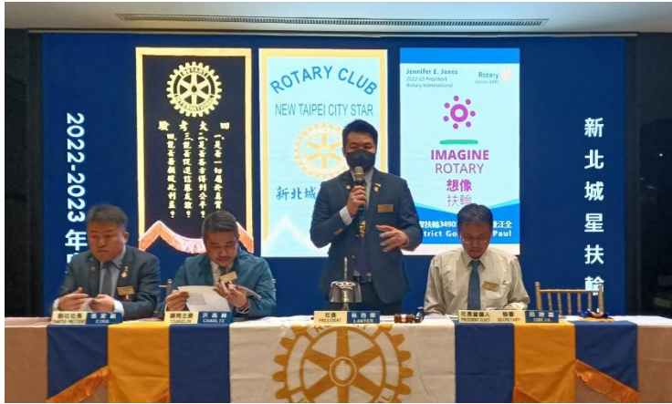
P Lawyer 主持第 136 次例會