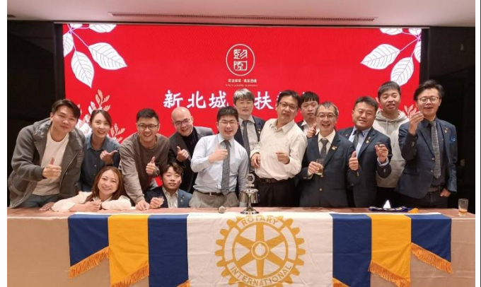
爐主敬酒，感謝本次爐主們的盛情招待