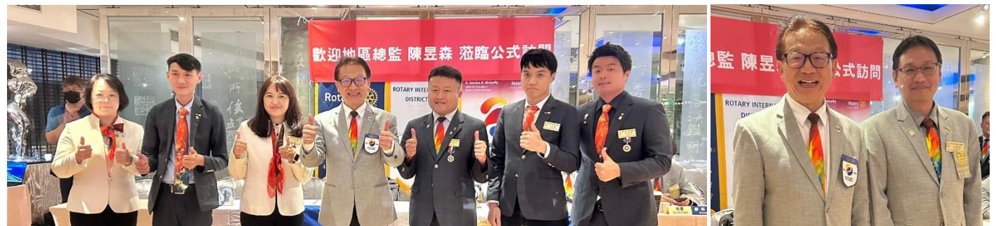
認捐 PHF :