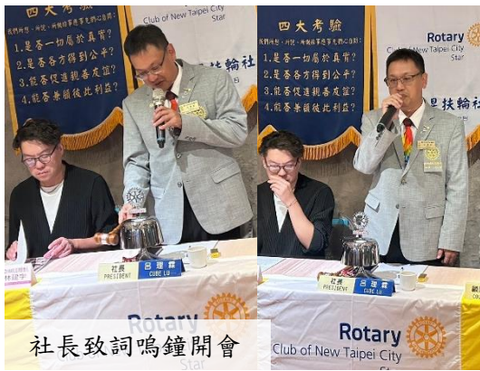
社長致詞鳴鐘開會