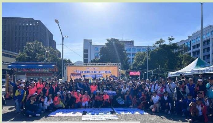
七扶輪社全體合影