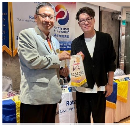
主講人：林建宇、講題：IP 創業從 0-1