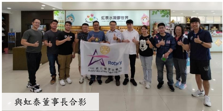
與虹泰董事長合影