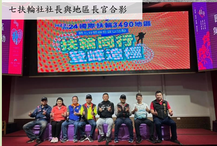
七扶輪社社長與地區長官合影