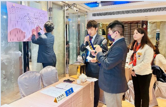
理事選舉唱票、計票中